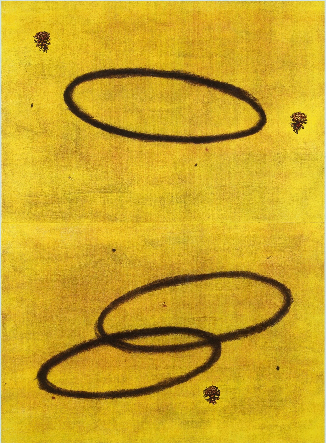
「松にふれて2016-1」(コラグラフ) 129×95cm