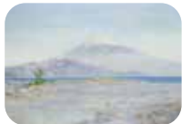
芸術の源泉エリア