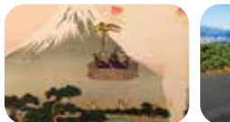
三保松原のさらなる広がリエリア