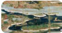
富士山信仰と三保松原エリア