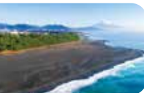
未来に引き継ぐエリア