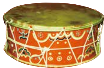
答籠鼓（とうろうこ）