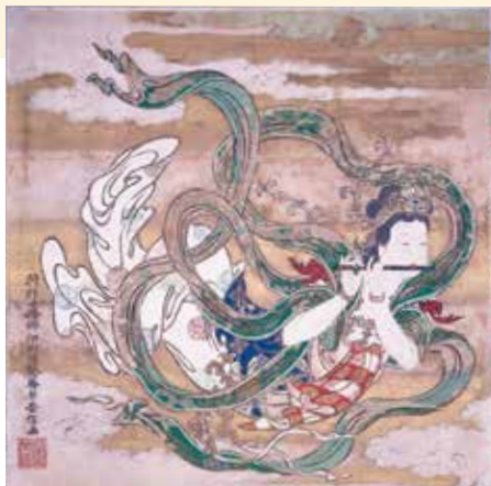
大拝殿天井絵「天人」（写真展示） 静岡浅間神社所蔵

今回の企画展では、天人を描いた絵画・彫刻の写真や、演奏する天人が多数描かれている敦煌莫高窟壁画を元に復元された楽器を展示し紹介します。音楽という視点から、「羽衣」の物語の世界を想像してみましょう。