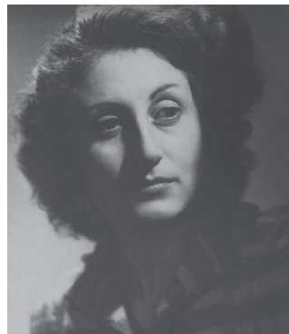
エレーヌ・ジュグラリス

フランス人の舞踊家 エレーヌ・ジュグラリス (1916-1951) は、1940年代に日本の能に出会い魅了され、能と日本文化の研究に情熱を注ぎました。第二次世界大戦下で資料を集めることは非常に困難でしたが、夫のマルセルや日本研究者達の支えのもと、謡曲「羽衣」の翻訳を完成させ、1949年にパリで「羽衣」の上演を成功させました。エレーヌの公演は好評を博しましたが、初演から僅か2年後の1951年に、病のため35歳の若さで亡くなりました。彼女の死後、三保松原を訪れたマルセルから話を聞いた人々は心を打たれ、旧清水市と市民が協力し「羽衣の碑 (エレーヌの碑)」を建立しました。