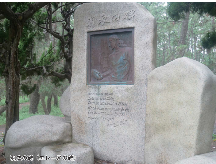
羽衣の碑（エレーヌの碑）