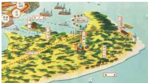
静岡電気鉄道沿線案内(三保半島部分)／1927年発行 静岡市歴史博物館所蔵