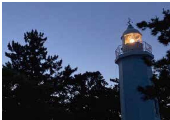
3 点灯時の清水灯台