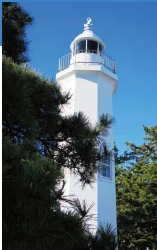
清水灯台と松

今回の企画展では、三保松原の一角にあり、富士山の眺望とともに愛され、令和4年度には国の重要文化財に指定された「清水灯台」とその周辺エリアについて、写真などの資料を展示し紹介します。