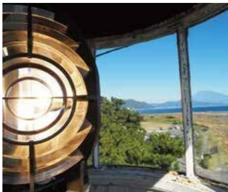
2 清水灯台のレンズと富士山