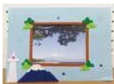
フォトスタンド 完成イメージ