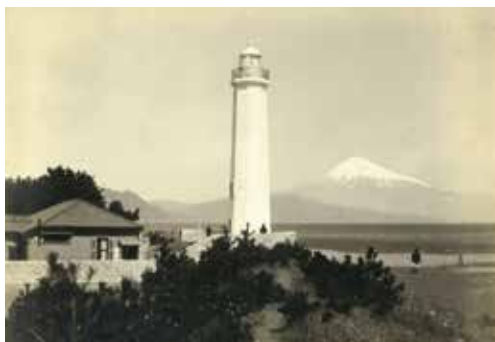
点灯開始(明治45年)頃の清水灯台

清水灯台は、日本初の鉄筋コンクリート造の灯台で、点灯開始から110年以上になります。