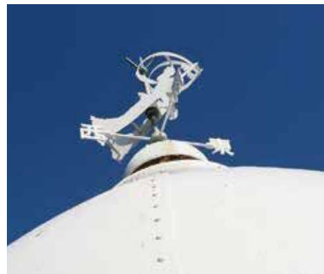
4 清水灯台・天女の風見鶏