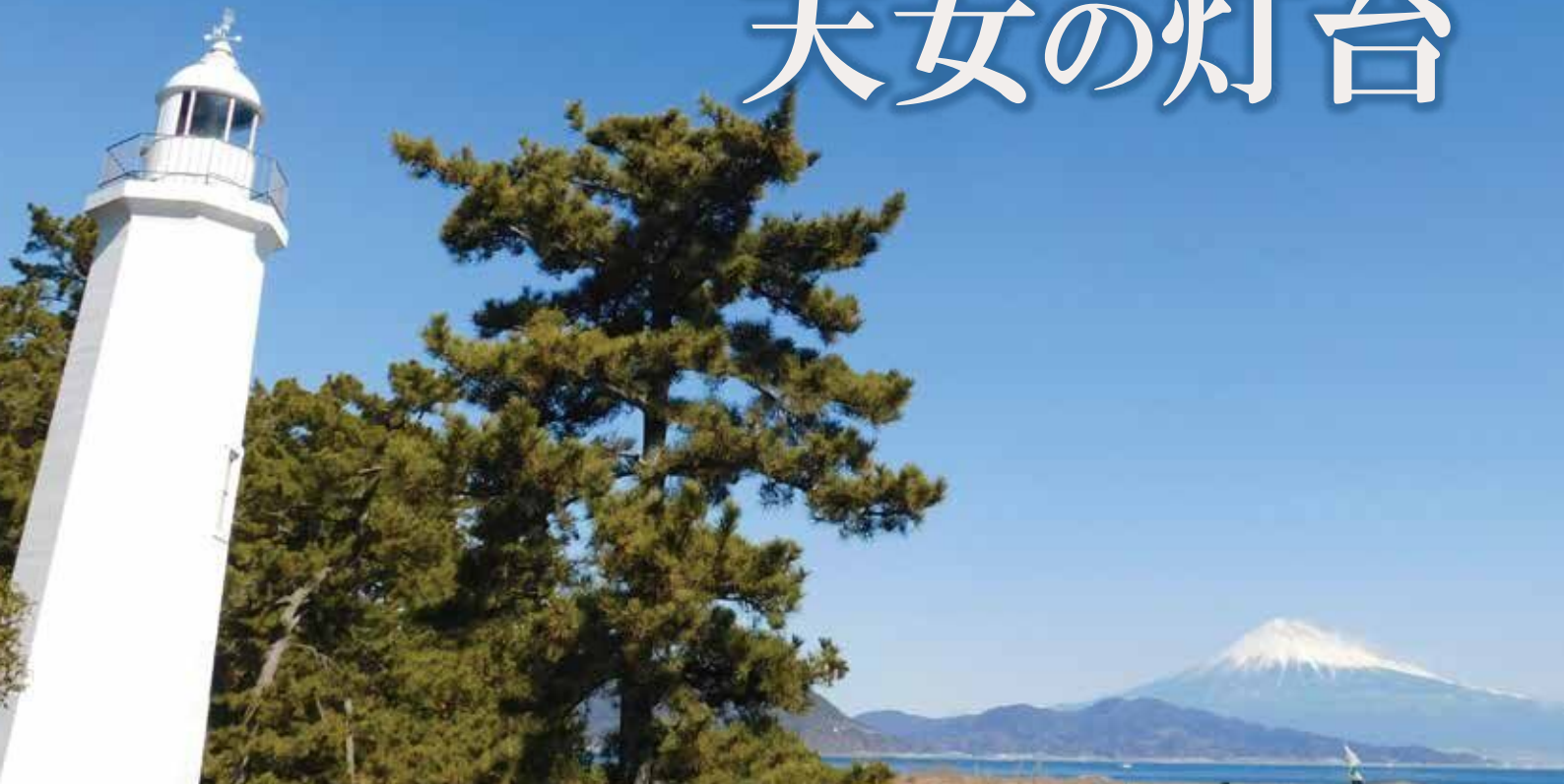
1 富士山と清水灯台