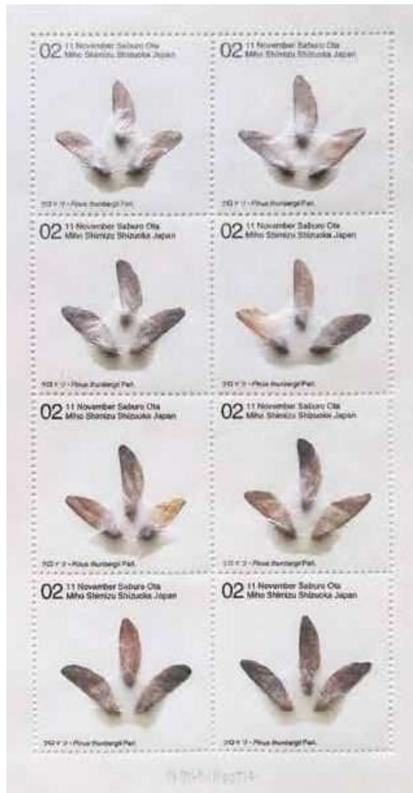
《クロマツ・Pinus thunbergii Parl.》2002年