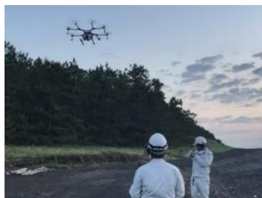
ドローンによる散布状況

その結果、無人ヘリと比べ、より効果的で安全性が高いことが確認されたことから、継続してドローンによる散布を実施しています。