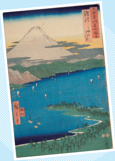
歌川広重-駿河 三保のまつ原 (六十余州名所図会)

清水エスパルスのクラブハウス・練習場のある三保半島は、富士山頂から南西に約45km離れた静岡県静岡市清水区にあり、沿岸の約5kmにわたり、松林が広がっています。この松林が「三保松原」と呼ばれ、1922年に日本初の名勝に指定、2013年6月には世界文化遺産「富士山」の構成資産に登録されました。松原の中央付近にある「羽衣の松」は天女と地元の漁師の出会いを描いた「羽衣伝説」の舞台として特に有名です。三保松原を形作る推定3万本のクロマツは、栄養が少なく、暑く乾燥する海辺の環境でも立派に育ち、海からの風や砂を受け止めることで、家や畑を守る役割を担っています。