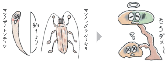
カミキリがかじった元気なマツに線虫が侵入